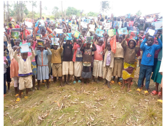
La joie des enfants après réception des kits scolaires octroyés par les GS

2014. Il s'agit de 38 filles et 19 garçons.