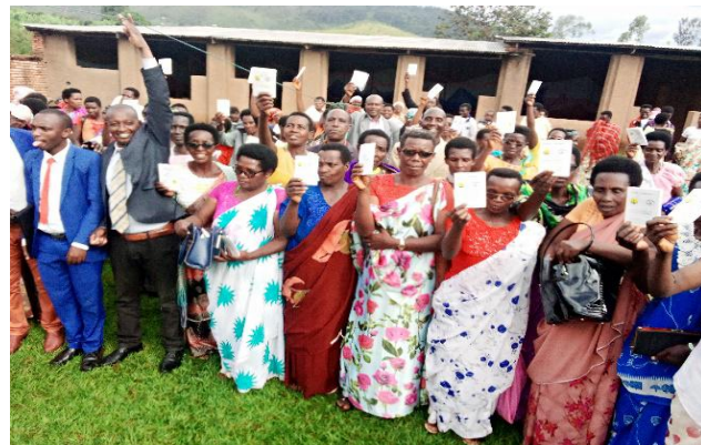
Photo de famille après une séance de Séance d'échanges sur la carte de Santé communautaire « MTT » en commune et Province Rumonge

Pour cette année 2022, on a enregistré 3661 ménages qui ont adhéré à la MTT composés de 14 157 bénéficiaires ( 5028 femmes et 9129 hommes) dont des cartes tenues par 202 OEV ( 118 filles et 84 garçons) vivant en ménages seuls ayant été achetées par les membres des groupes de solidarité.