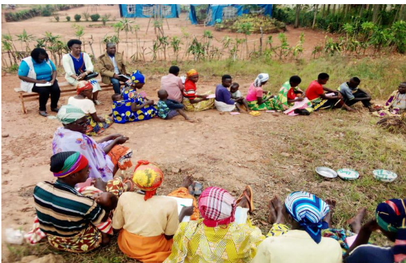
Supervision des activités par Mme la Représentante Légale de la FVS-Amie des Enfants des membres des Groupes de solidarité en séance de « Nawe n'uze », commune Mutaho, en province de Gitega.

Dans le cadre de la Coordination Générale des activités de l'Organisation, des descentes trimestrielles de supervisions aux 9 antennes provinciales de FVS-Amie des Enfants et à l'Ecole « Amie des Enfants » de Matana ont été effectuées par la Représentation Légale de la FVS-Amie des Enfants ainsi que les Conseillers Techniques du Département des Programmes et celui des Finances. A leur tour, les Coordonnateurs d'Antennes ont fait des descentes de suivi des activités sur terrain. En plus des réunions de Coordination entre le siège et les Antennes, des réunions hebdomadaires de planifications ont été aussi organisées.