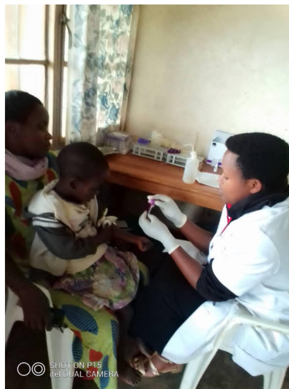
L'infirmière en pleines prestations de services au Centre Socio- Médicale de Bururi

patients bénéficient tous du suivi biologique et de l'accompagnement psychosocial. Certaines activités de lutte contre le VIH/SIDA sont réalisées dans le cadre du projet « WIYIZIRE » financé par USAID et que la FVS-Amie des Enfants réalise en consortium avec COPED en tant que chef de fil et d'autres organisations. Dans les provinces où on ne dispose pas de centres médicaux sociaux, les personnes vivant avec le VIH sont référés aux structures sanitaires publiques pour la prise en charge médicale.