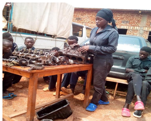
Les jeunes déscolarisés en formation en mécanique, commune de Gitega