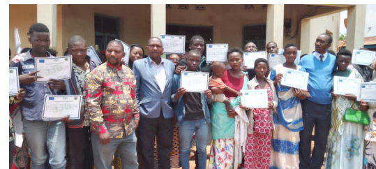
Cérémonie de réception des certificats aux jeunes après la formation professionnelle des jeunes, commune de Gitega