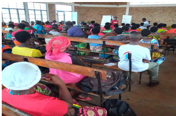
Séance de sensibilisation des membres des GS sur l'éducation nutritionnelle en commune Bukemba, province Rutana