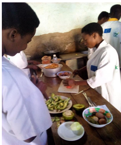
Les jeunes déscolarisés en pleine formation/pratique en art culinaire en province de Bujumbura