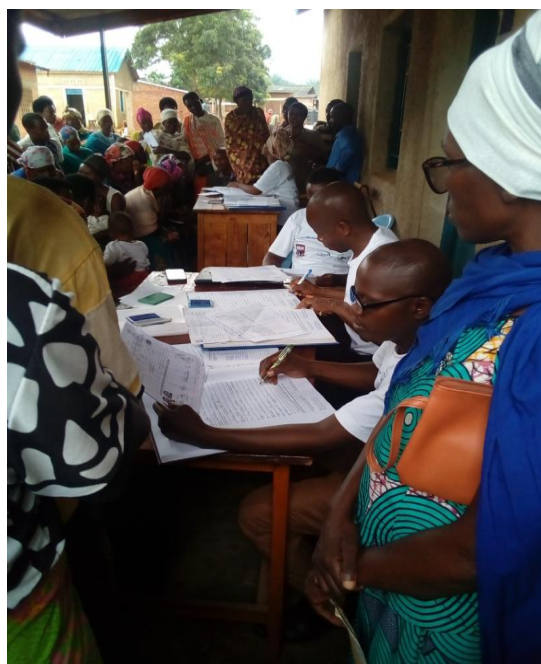
Enregistrements tardifs des naissances à Makamba en commune Nyanza-Lac, zone Muyange où on enregistre la majorité des rapatriés en provenance de la Tanzanie.

de FVS-Amie des Enfants, des représentants de Comités de protection des droits des Enfants et des groupes de solidarité ainsi que des responsables des écoles fondamentales partenaires. Au total, 1474 personnes ont été formées (910 femmes et 564 hommes).