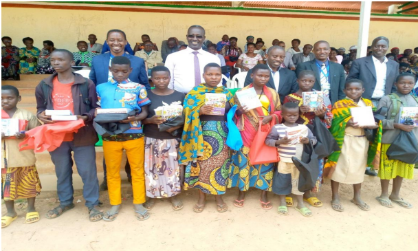
Participation de Mr le Gouverneur de la province de Bururi à la campagne de distribution des kits scolaires aux OEV par les GS

La FVS-Amie des enfants a continué à renforcer de façon visible les familles tutrices d'OEV regroupés groupes de solidarité de prise en charge des OEV. L'une de leur mission est de contribuer à la scolarisation des OEV sous leur encadrement.